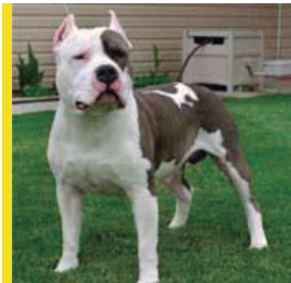
American Staffordshire Terrier