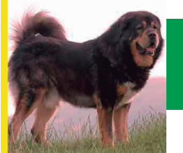
Dogo del Tibet