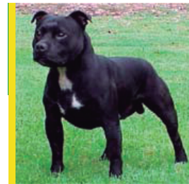
Staffordshire Bull Terrier