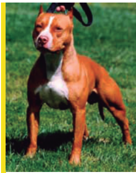
Pit Bull Terrier